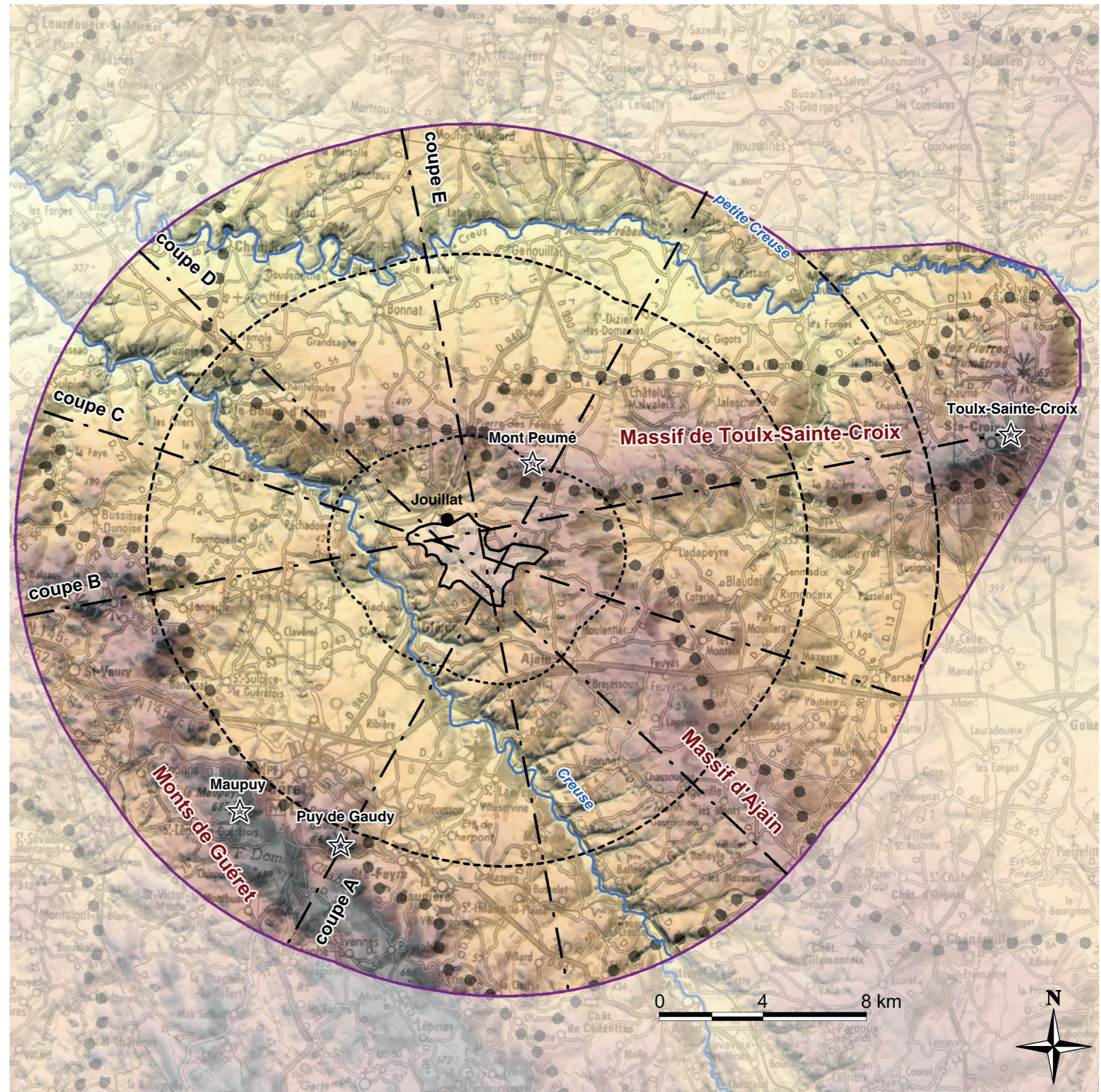
Carte 7 : Le site d'étude dans son contexte physique